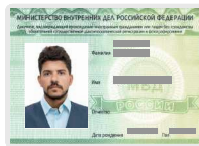
Свидетельство о дактилоскопической регистрации