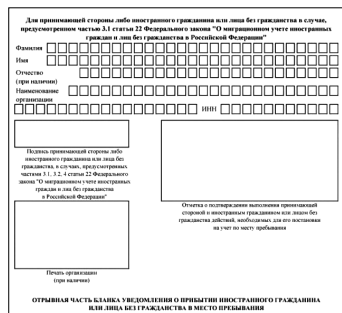
Регистрация/постановка на миграционный учет